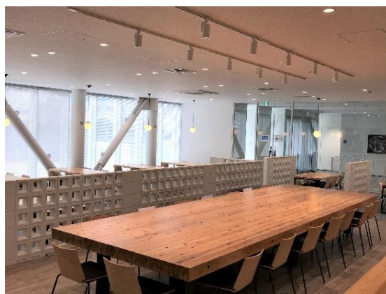
川北先生デザインのテーブル