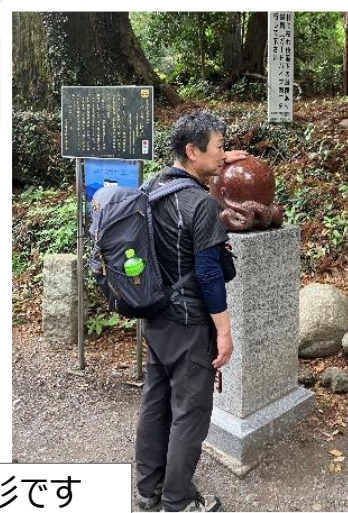
樹齢450歳のたこ杉です