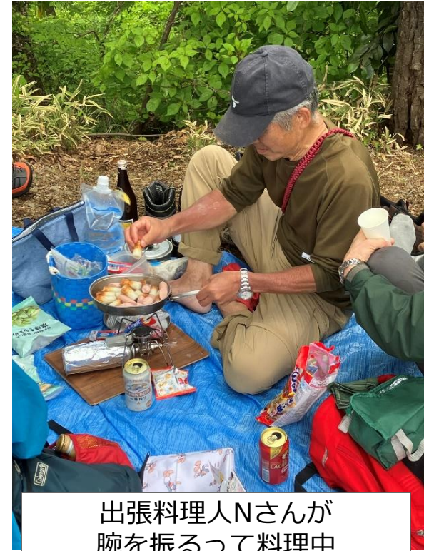
出張料理人Nさんが腕を振るって料理中