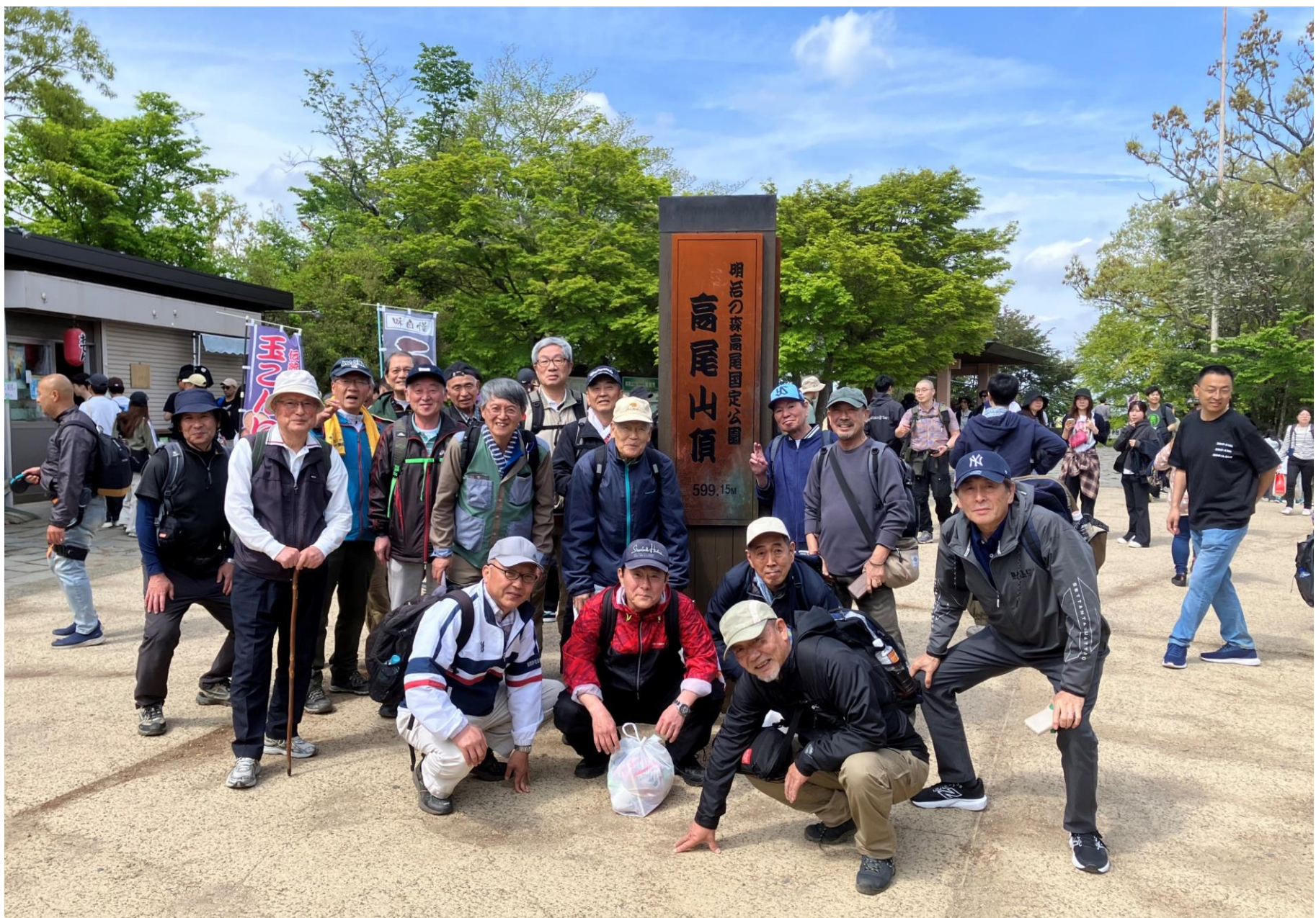
高尾山山頂で集合写真