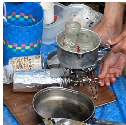
日陰は少し寒い・・・では 熱燗 お願いします