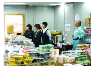
臨時売店内の様子