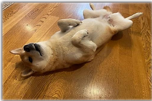
ヘソ天している ヒメ