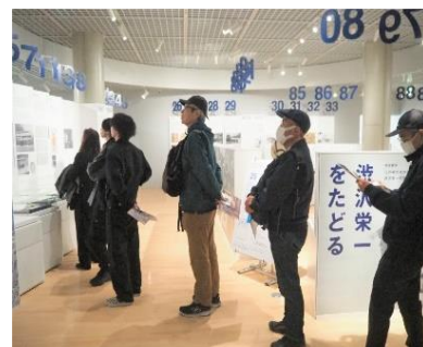
皆さん熱心に鑑賞です