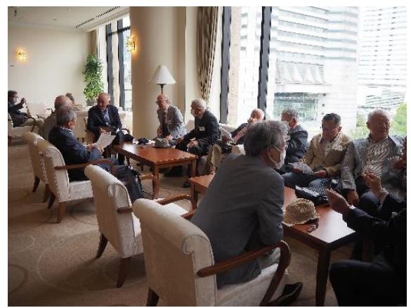
みなさん開会前 ラウンジにて歓談