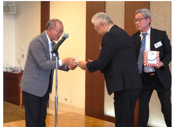
東亜石油社長賞 大掛さん当選