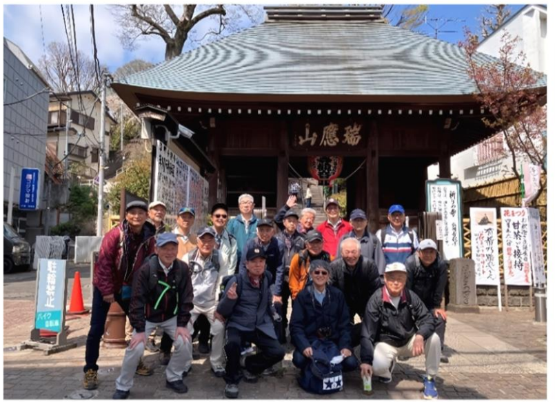
弘明寺仁王門前で全員集合