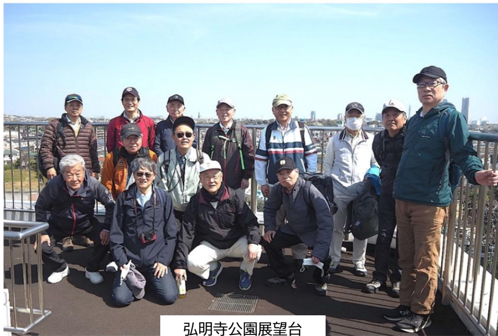
弘明寺公園展望台

京急弘明寺駅に10時に集合。まず駅に直結した横浜市を360度眺望できる弘明寺公園展望台で集合写真を一枚。残念ながら富士山は拝めませんでしたが快晴。弘明寺に参拝し安全祈願をしてから、大岡川の観音橋までの「昭和の商店街」を感じさせる参道を進み、大岡川沿いの桜並木を目指しました。この商店街、花見客も加わり、大勢の人でにぎわっていました。