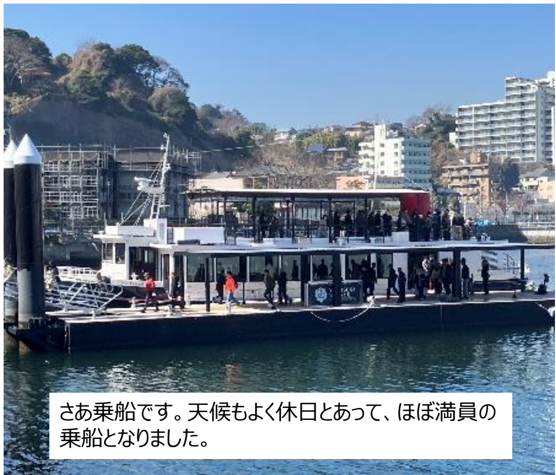
さあ乗船です。天候もよく休日とあって、ほぼ満員の乗船となりました。