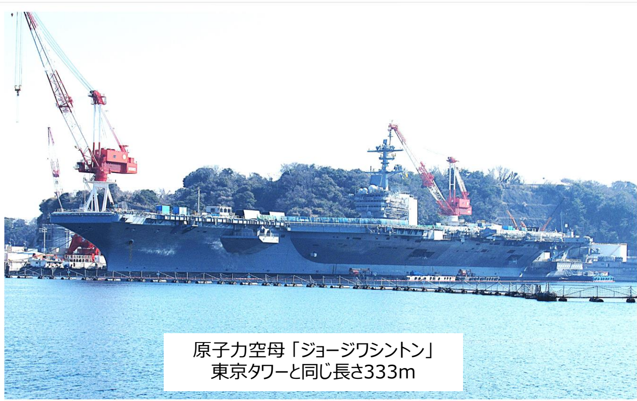
原子力空母「ジョージワシントン」 東京タワーと同じ長さ333m