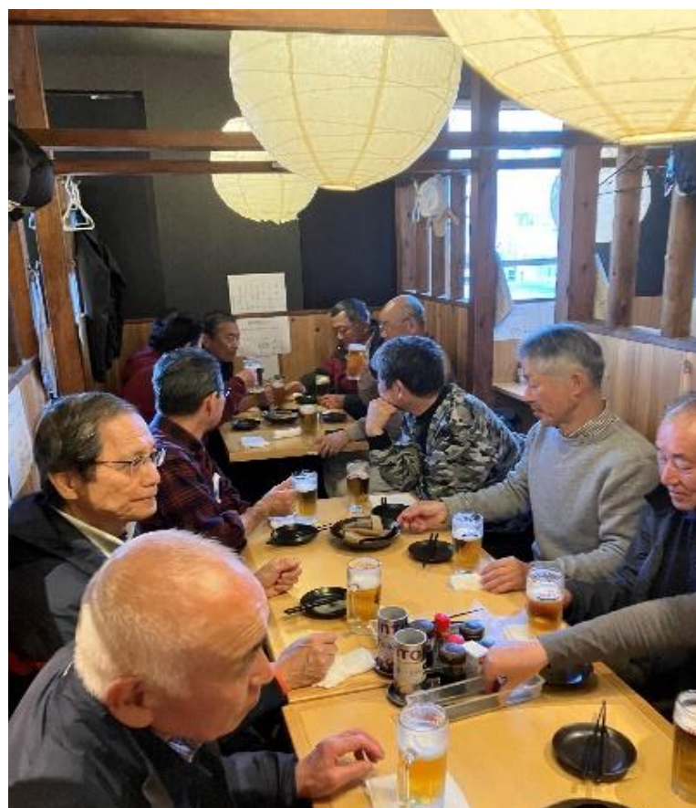
横須賀中央駅前の居酒屋での反省会 いつものように盛り上がり、無事帰宅となりました。今回は16,000歩のウォーキングでした