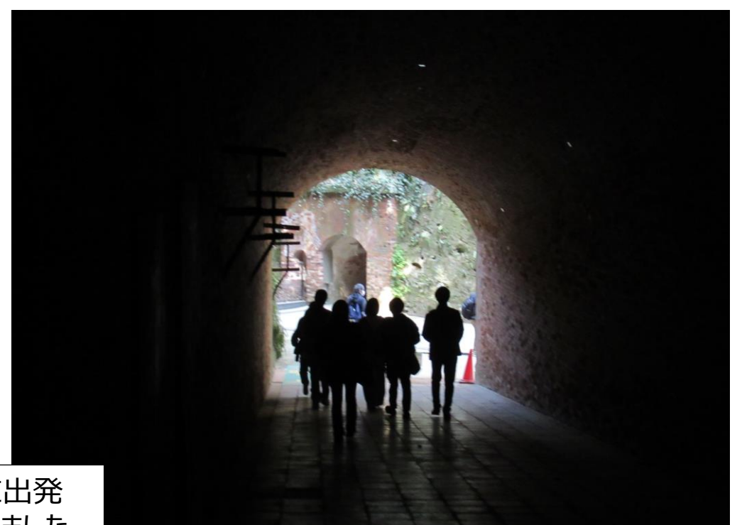
本日の目的「猿島探索ウォーキング」に出発 ただ、ベンチのままのメンバーも何人かいました