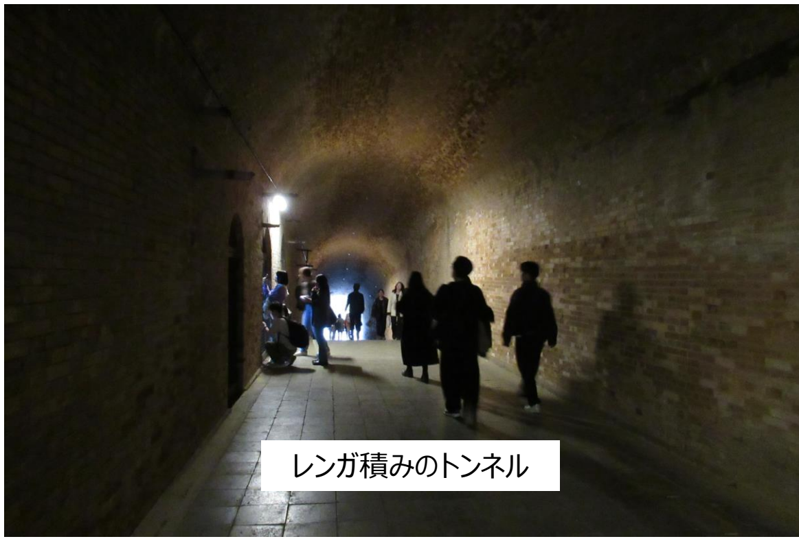
レンガ積みのトンネル