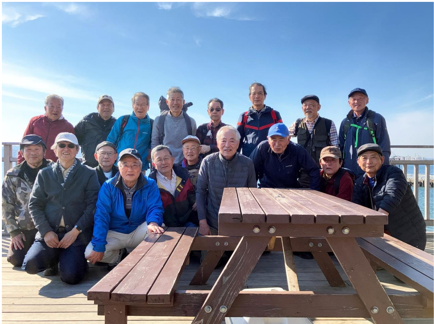
猿島にて参加メンバー