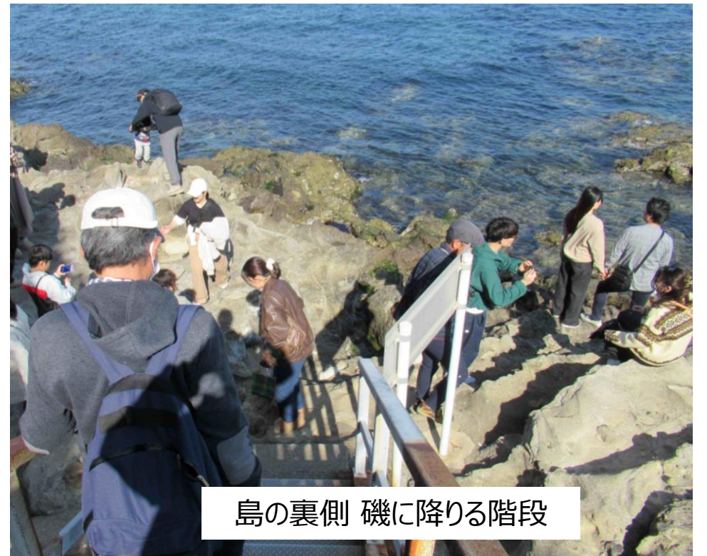
島の裏側 磯に降りる階段