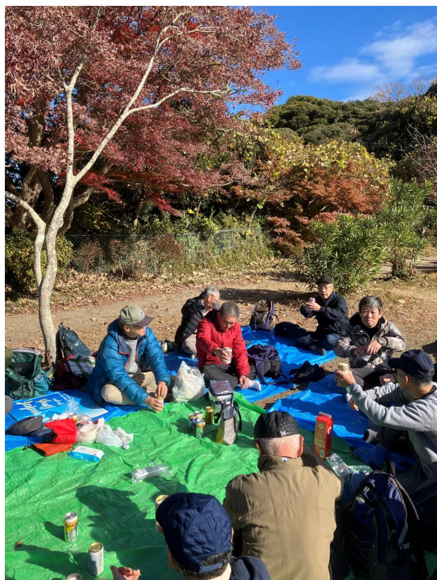
それではカンパーイ！