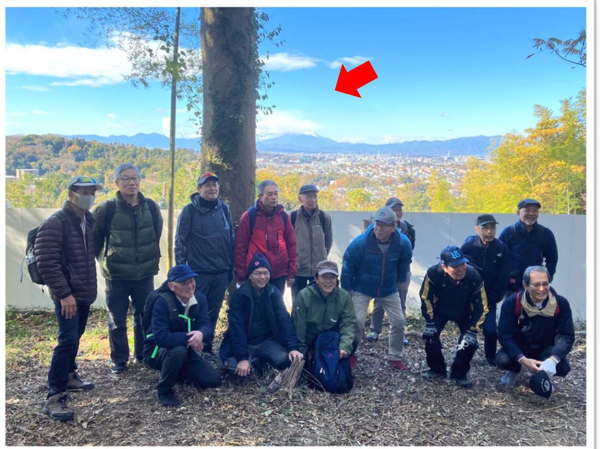
葛原岡神社で富士山を バックにパチリ