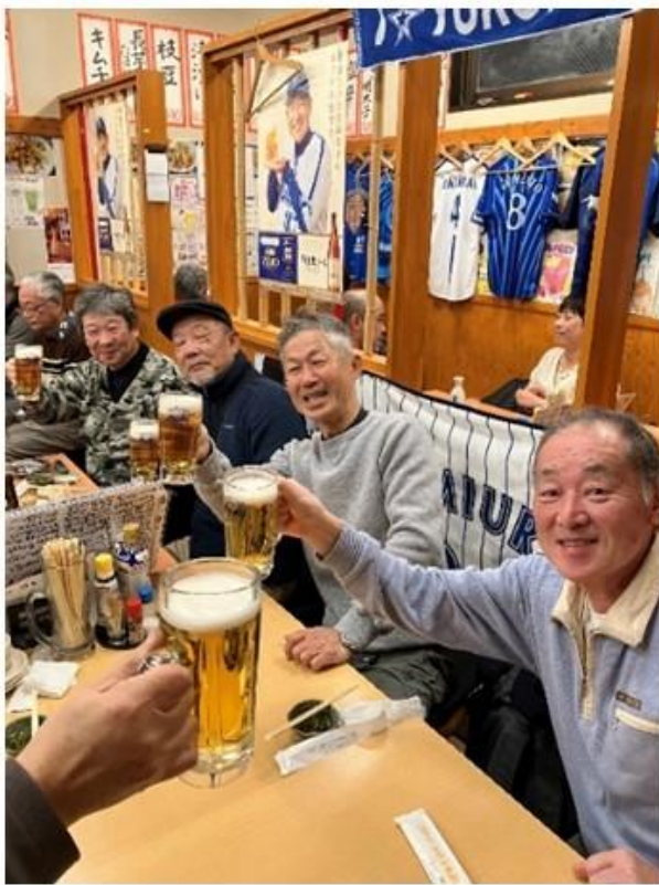
大船駅近くの居酒屋「亀松」さんで反省会

今回お世話になりました居酒屋 『亀松』さんはおつまみメニューも 豊富でとても良かった★★★。また 飲み放題メニュー充実してました ★★★。