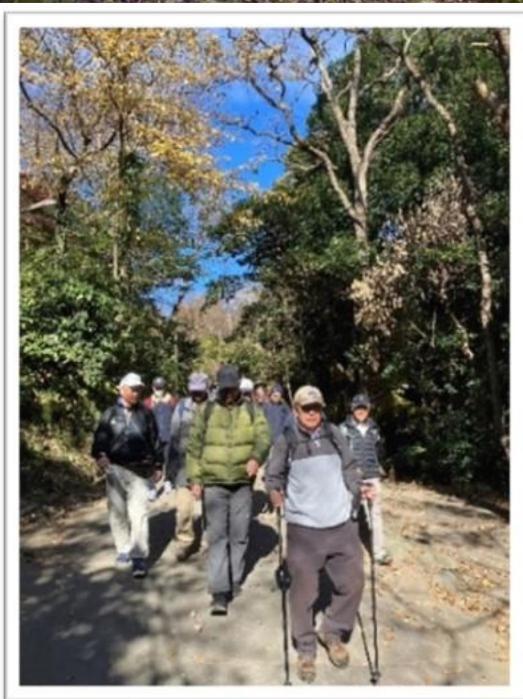
まだまだ元気です