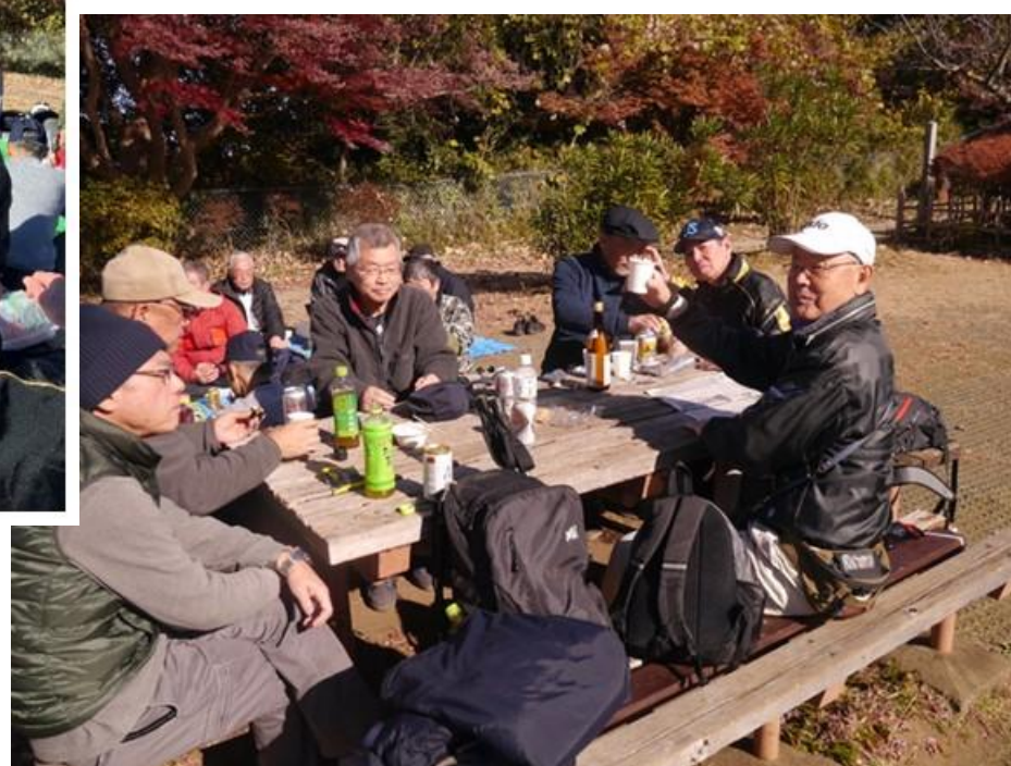
日本酒でカンパーイ！