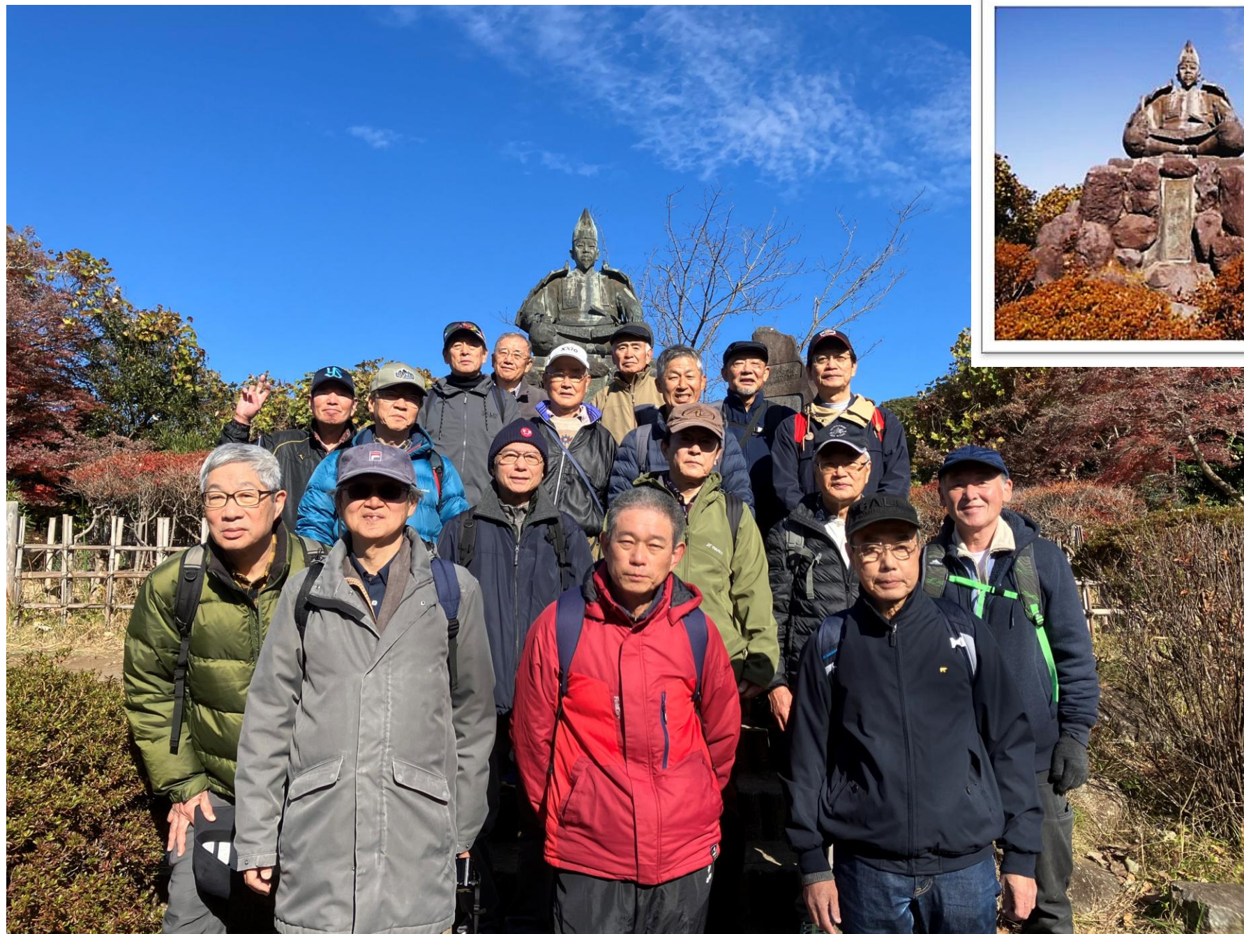
源頼朝公銅像前にて