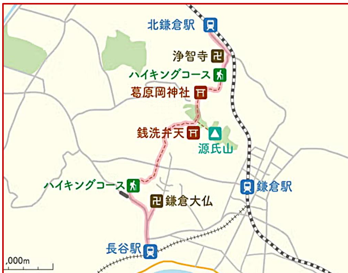
今回のウォーキング行程図です

北鎌倉駅から鎌倉駅まで約4kmの コースでした。大仏は今回パスです。 皆さん、お疲れ様でした。