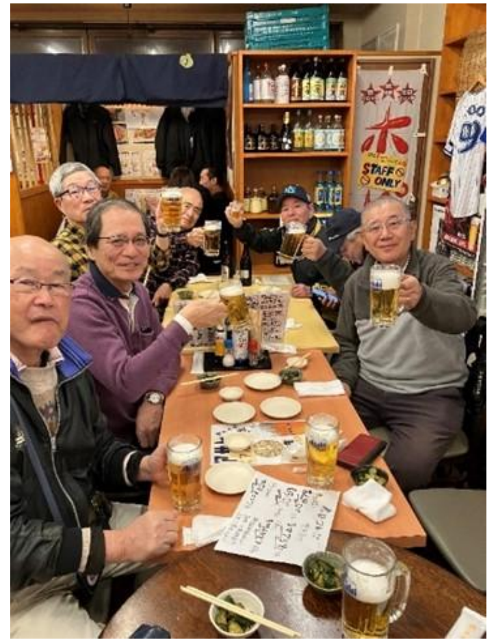
反省会の盛り上がりはいつも どうりです