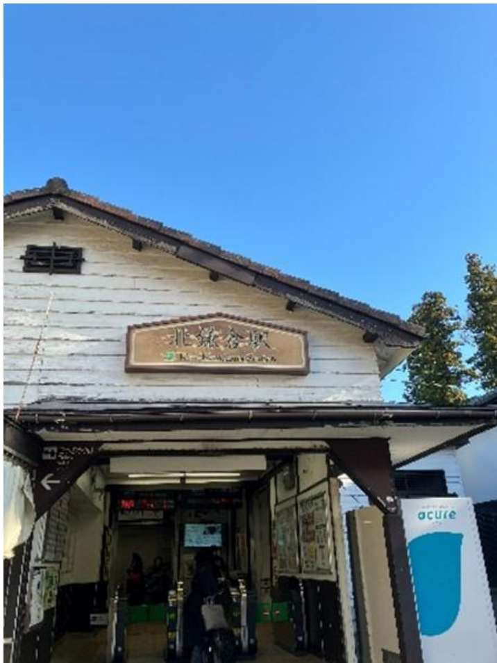
北鎌倉駅から出発 なかなかおもむきの ある駅ですね