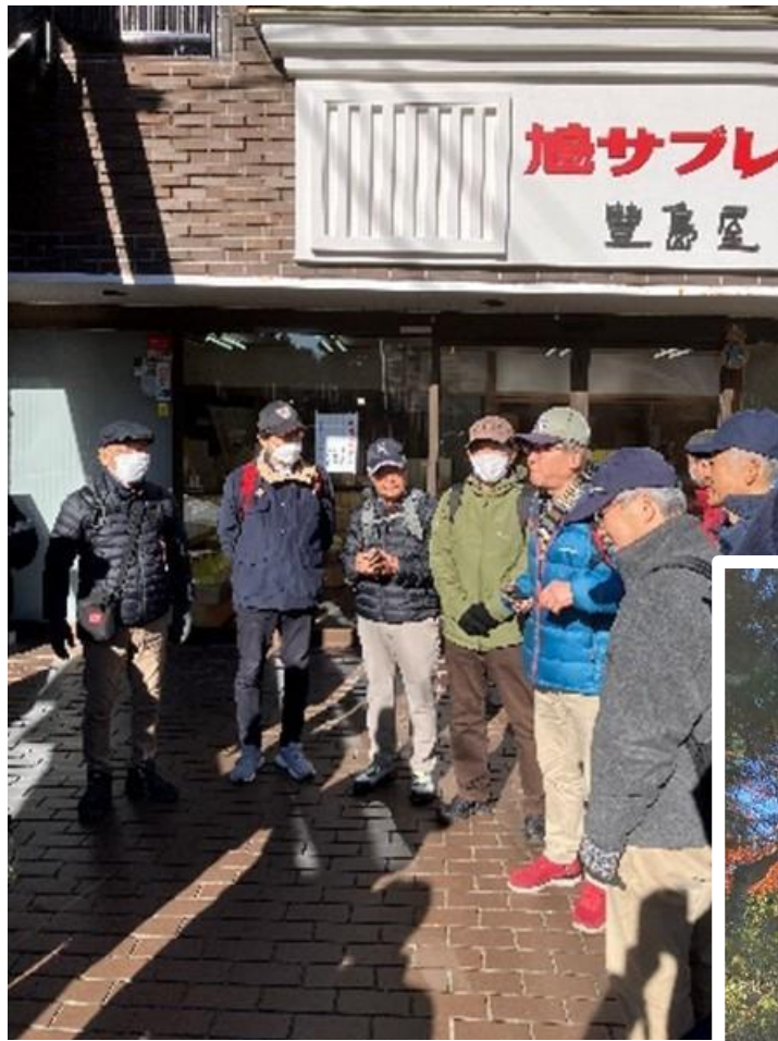
幹事から注意事項 とコース説明